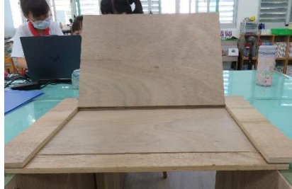
有背板的桌面模式